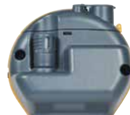
Quikstick ST POL78751, standard med alle MMS3-sett og med samme ytelse som standard Quikstick. En Quikstick ST kan forbli koblet til MMS3 mens du bruker pinnene.

Avlesninger fra flere Hygrosticks kan enkelt tas og registreres. Fuktighetsavlesninger kan tas ved bruk av fuktighetshylser eller fuktighetsboks. Hygrosticks, ikke Humisticks, skal brukes til denne testen.