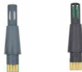
Hygrostick delenummer POL4750, for bruksområder med høy fuktighet.