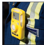
Enkel å bruke