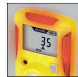
Enkel å se