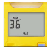
Enkel å lese