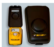
Bæreveske for dvalmodus